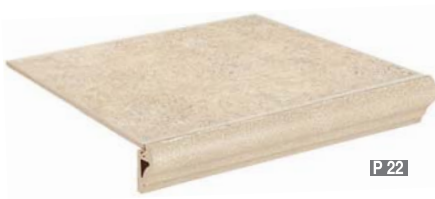
PELDAÑO FLORENTINO NASSAU BEIGE PELDAÑO FLORENTINO NASSAU SAND 30 x 30 cm.