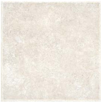
NASSAU SAND 30 x 30 cm.