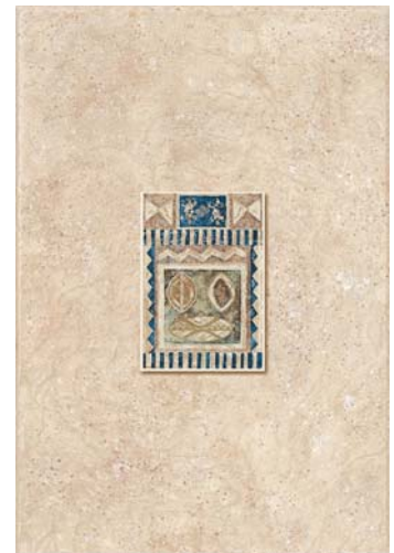
INSERTO YUCATÁN BEIGE P23 (NASSAU BEIGE) (NASSAU SAND) 30 x 45 cm.