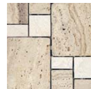
ESQUINA BAHAMAS 15 x 15 cm.