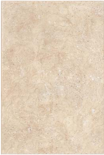
NASSAU BEIGE M13 30 x 45 cm.