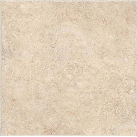
NASSAU BEIGE 45 x 45 cm.