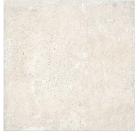
NASSAU SAND 45 x 45 cm.