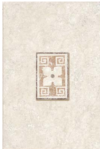
INSERTO ANDROS SAND P23 (NASSAU SAND) 30 x 45 cm.