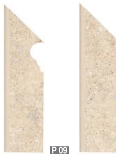
ZANQUÍN NASSAU BEIGE ZANQUÍN NASSAU SAND 8 x 30 cm.