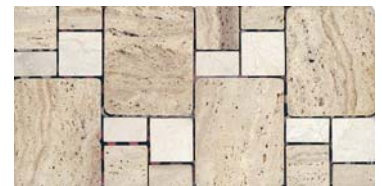
CENEFA BAHAMAS 15 x 30 cm.