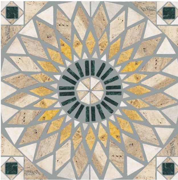
ROSETÓN BAHAMAS (4 PIEZAS) 60 x 60 cm.