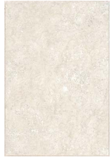
NASSAU SAND M13 5 30 x 45 cm.