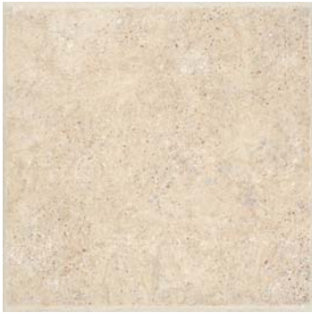
NASSAU BEIGE 30 x 30 cm.