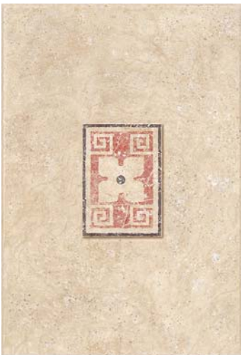
INSERTO ANDROS BEIGE P23 (NASSAU BEIGE) 30 x 45 cm.