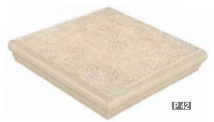
ÁNGULO FLORENTINO NASSAU BEIGE ÁNGULO FLORENTINO NASSAU SAND 30 x 30 cm.